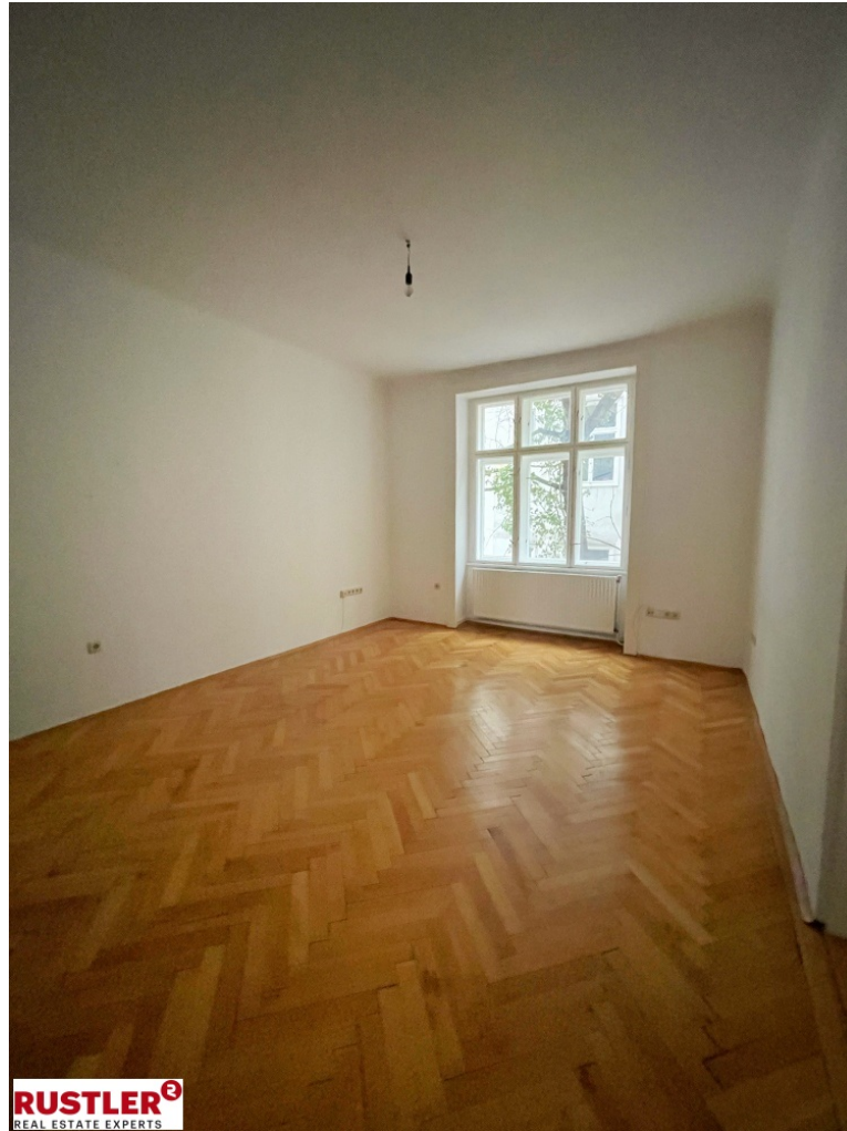
Wohnraum Ansicht 2