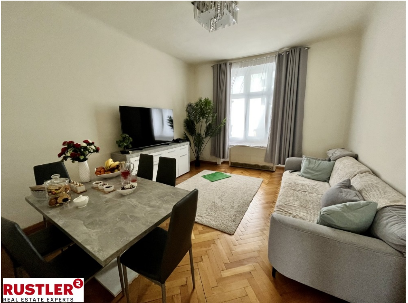
Wohn & Essbereich