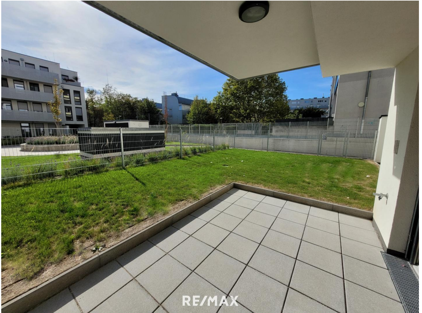
Terrasse vor dem Wohnraum & Garten