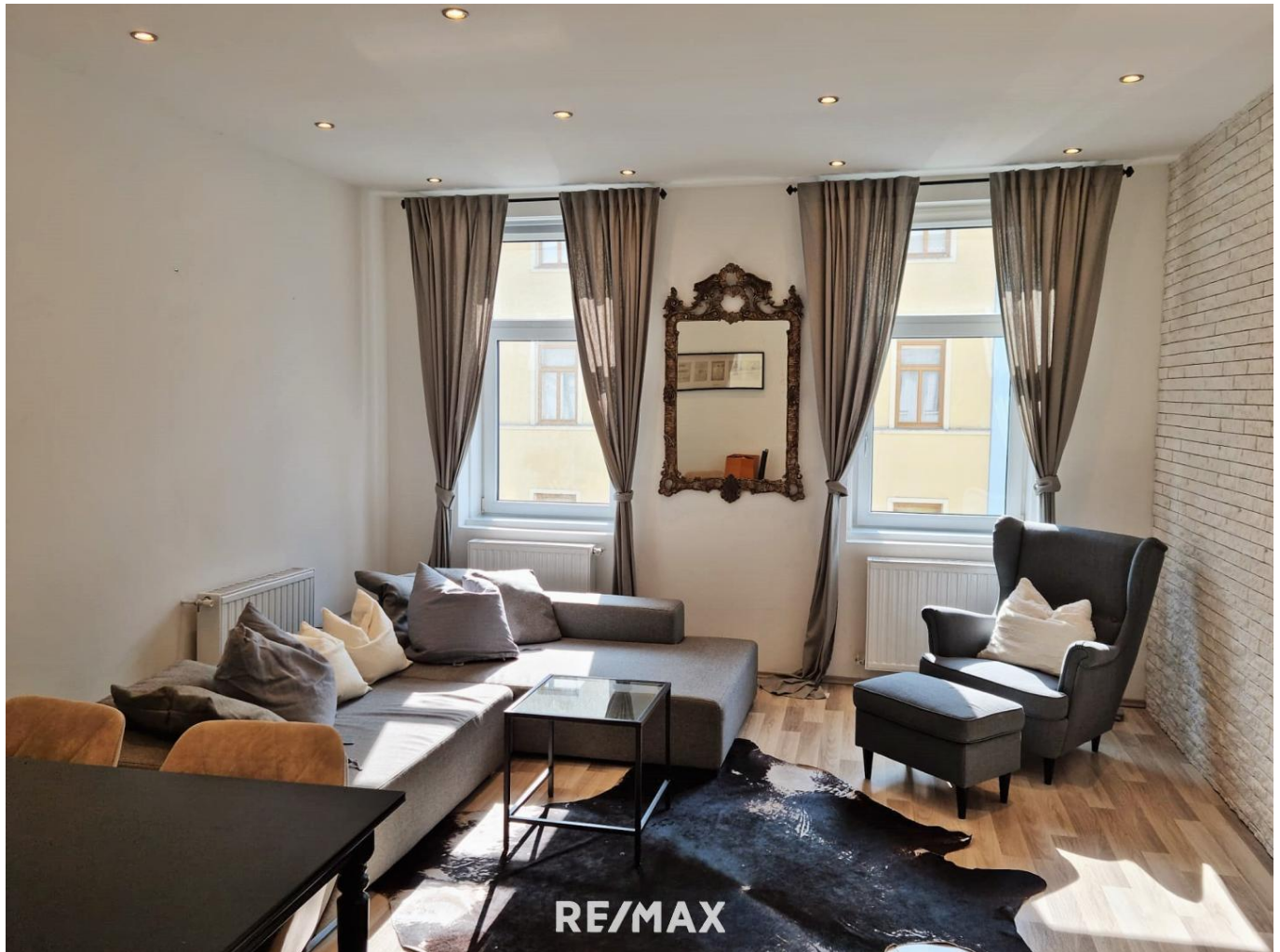
helles großes Wohnzimmer