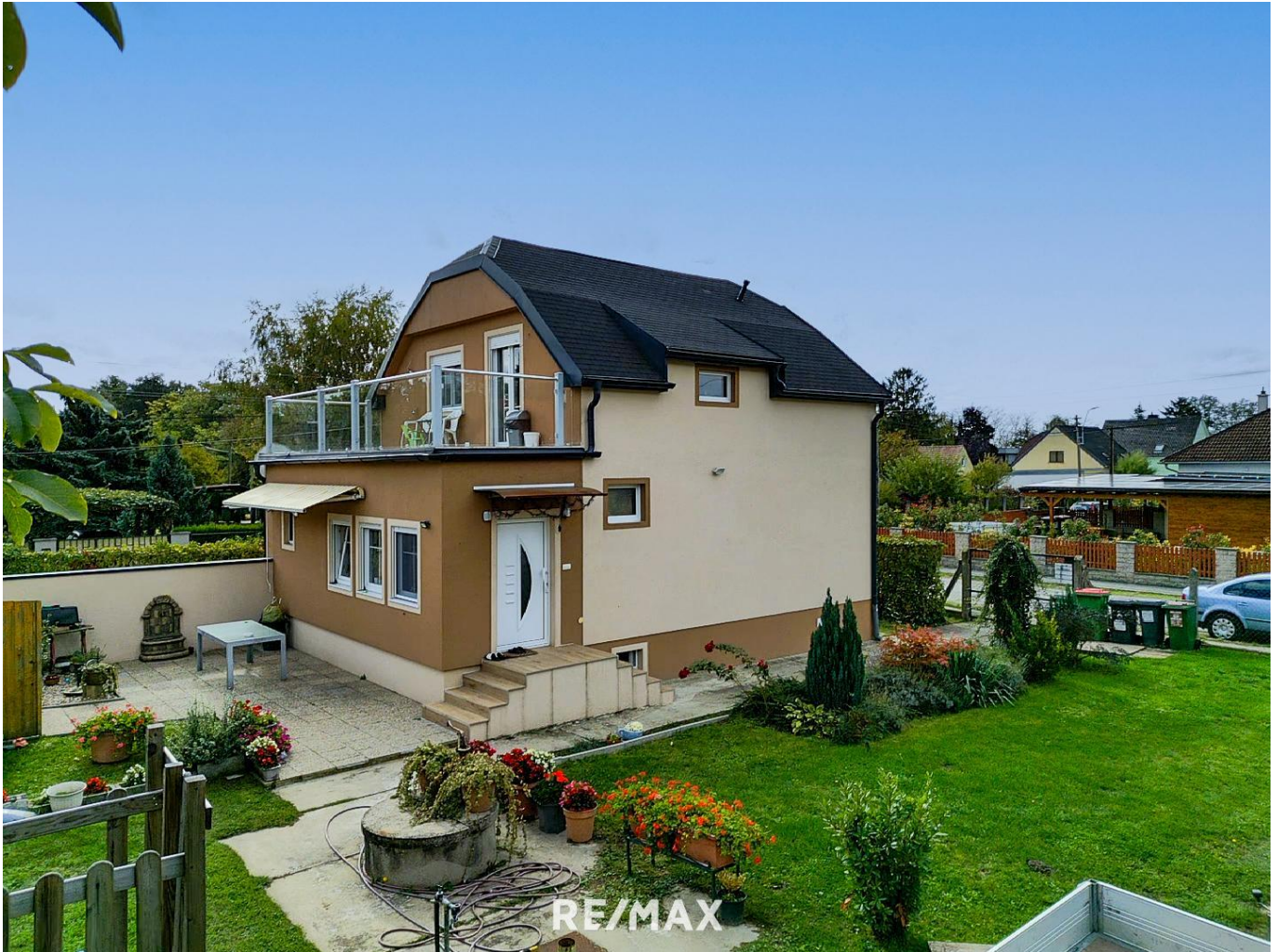
Haus und Garten