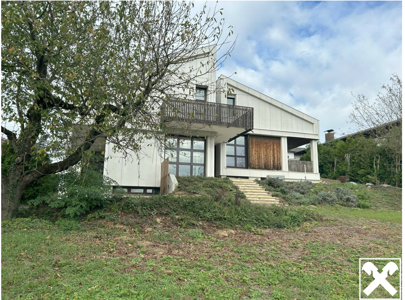
Außenansicht Quellengasse 10 4072 Straßham