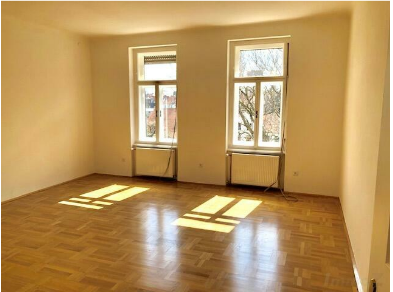
Zimmer 1 (straßenseitig)

ab 1.2.2025- klassische 2 Zimmer- Altbauwohnung im 2.0G mit Lift, neuwertiger Zustand