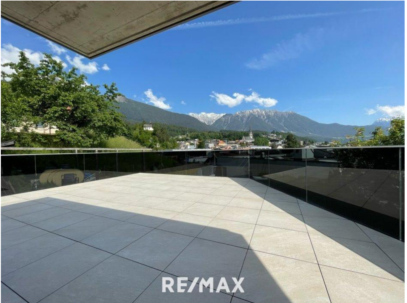
Wohnung - Terrasse