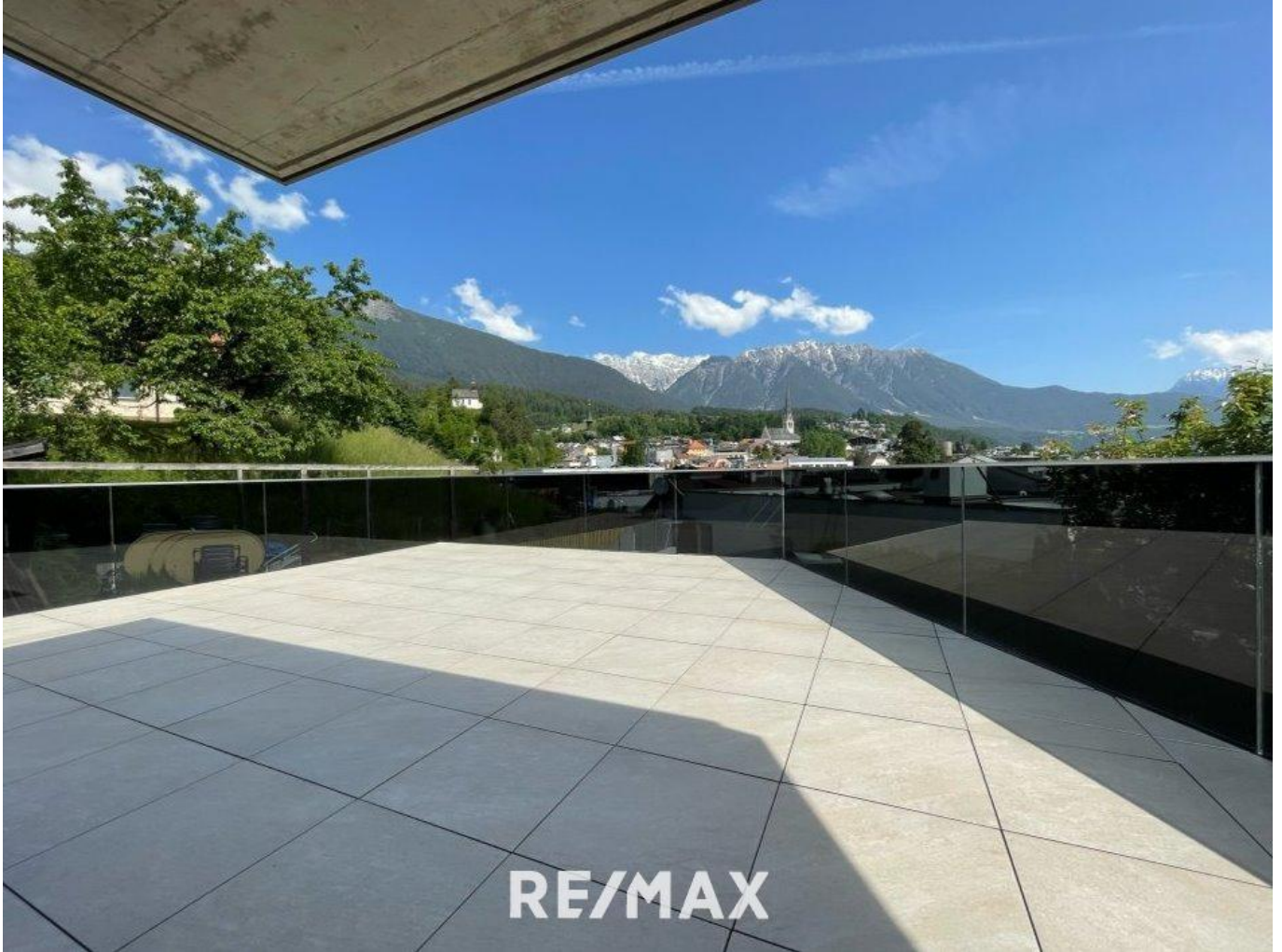
Wohnung - Terrasse