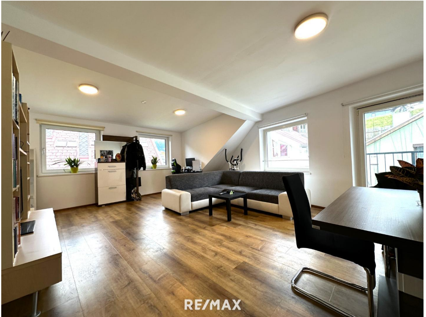
Wohnung - Wohnbereich