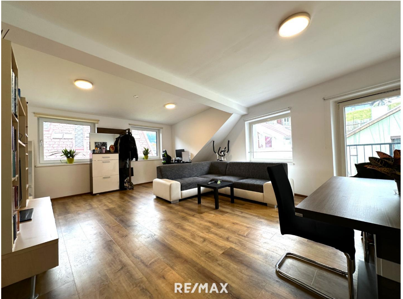
Wohnung - Wohnbereich