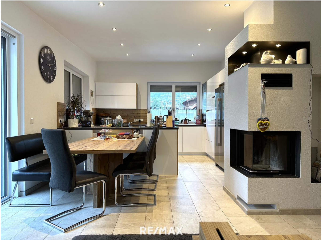
Wohnung - Koch und Essbereich