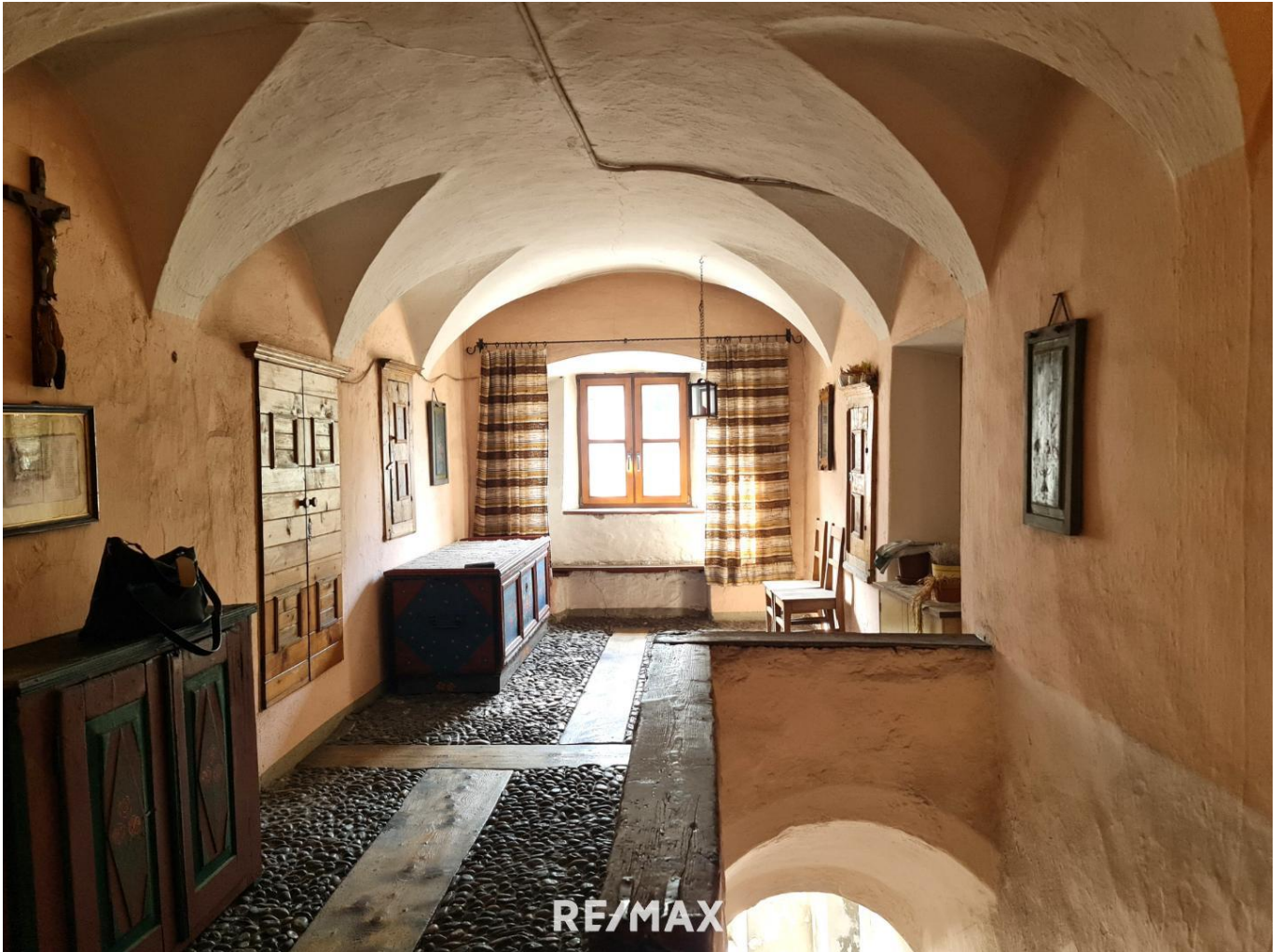
Haus - Hausgang OG