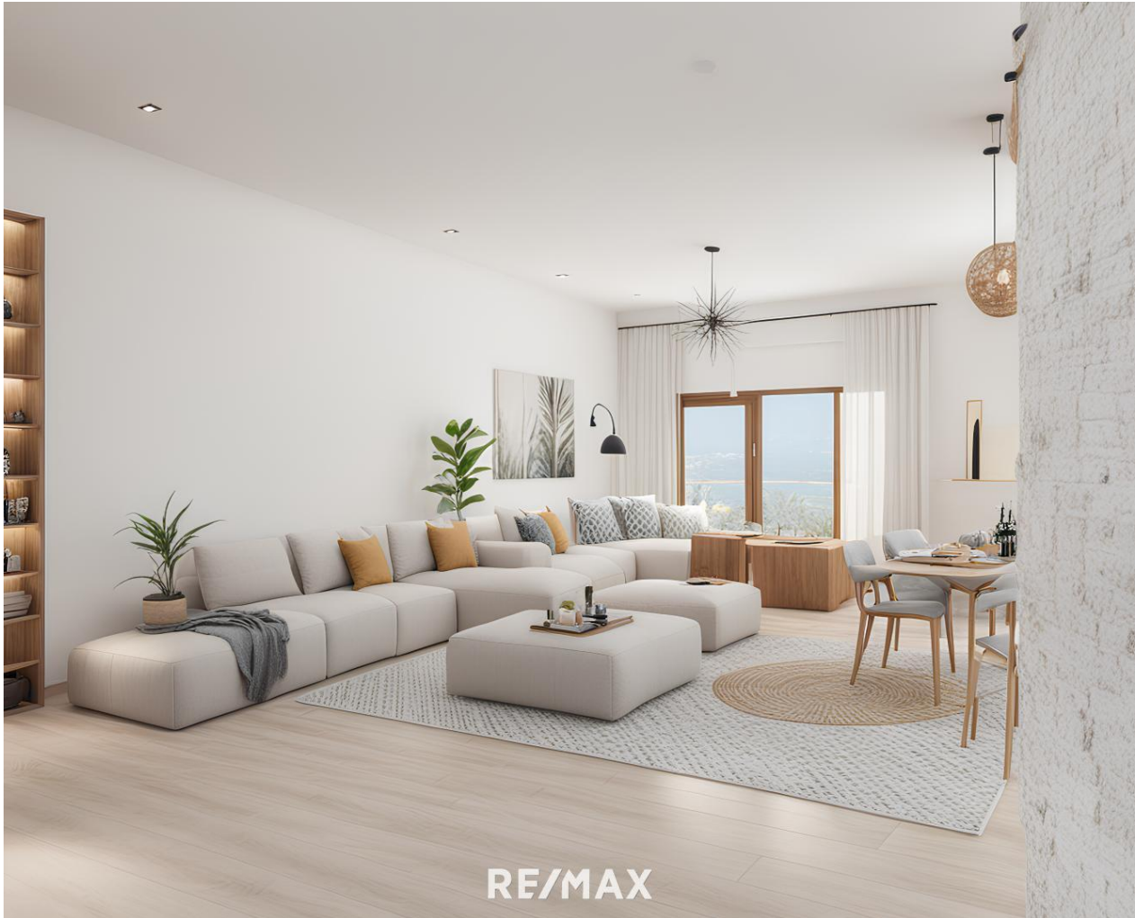
Wohnbereich - Musterfoto