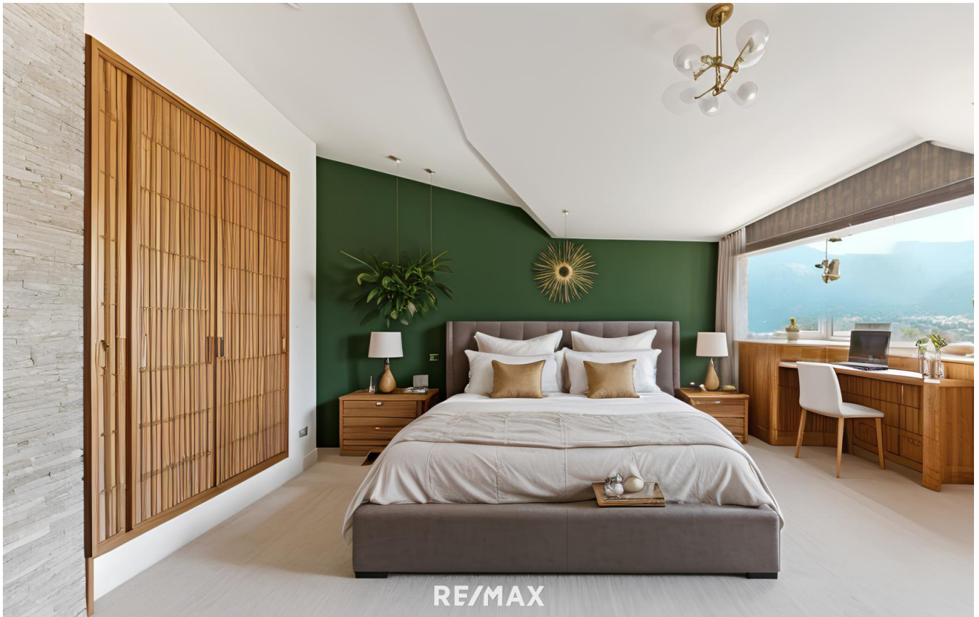
Schlafzimmer - Musterfoto