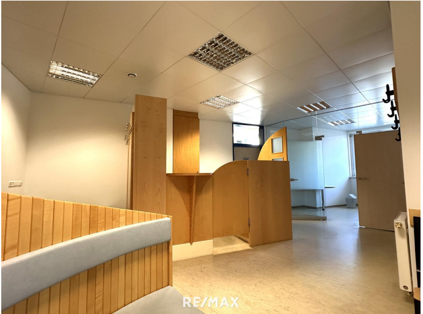
Ordination - Eingangsbereich