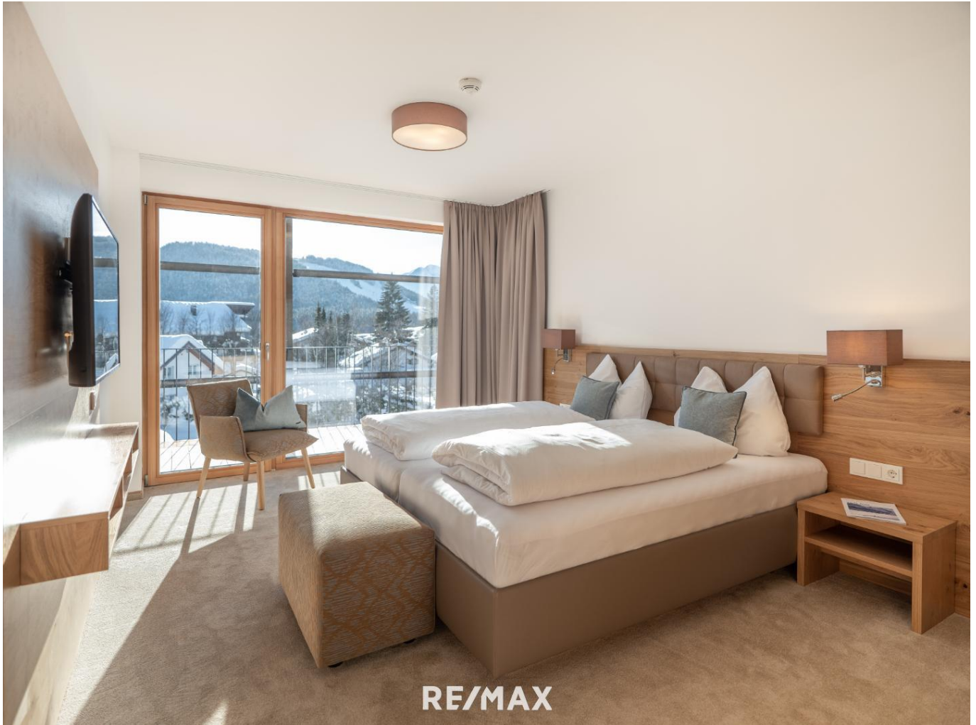
Wohnung - Schlafzimmer