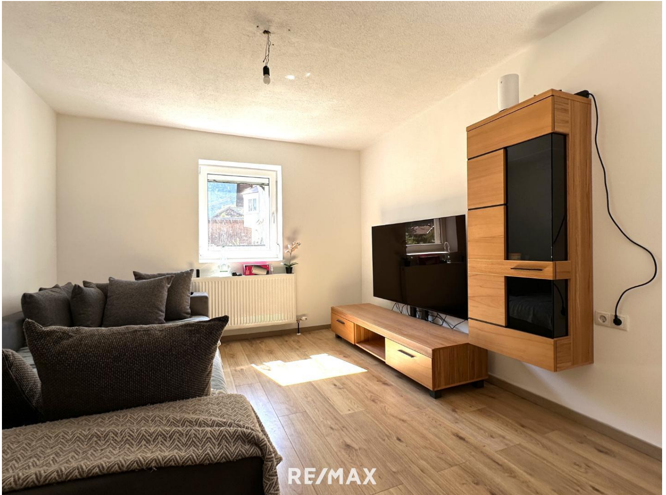
Wohnung - Wohnbereich