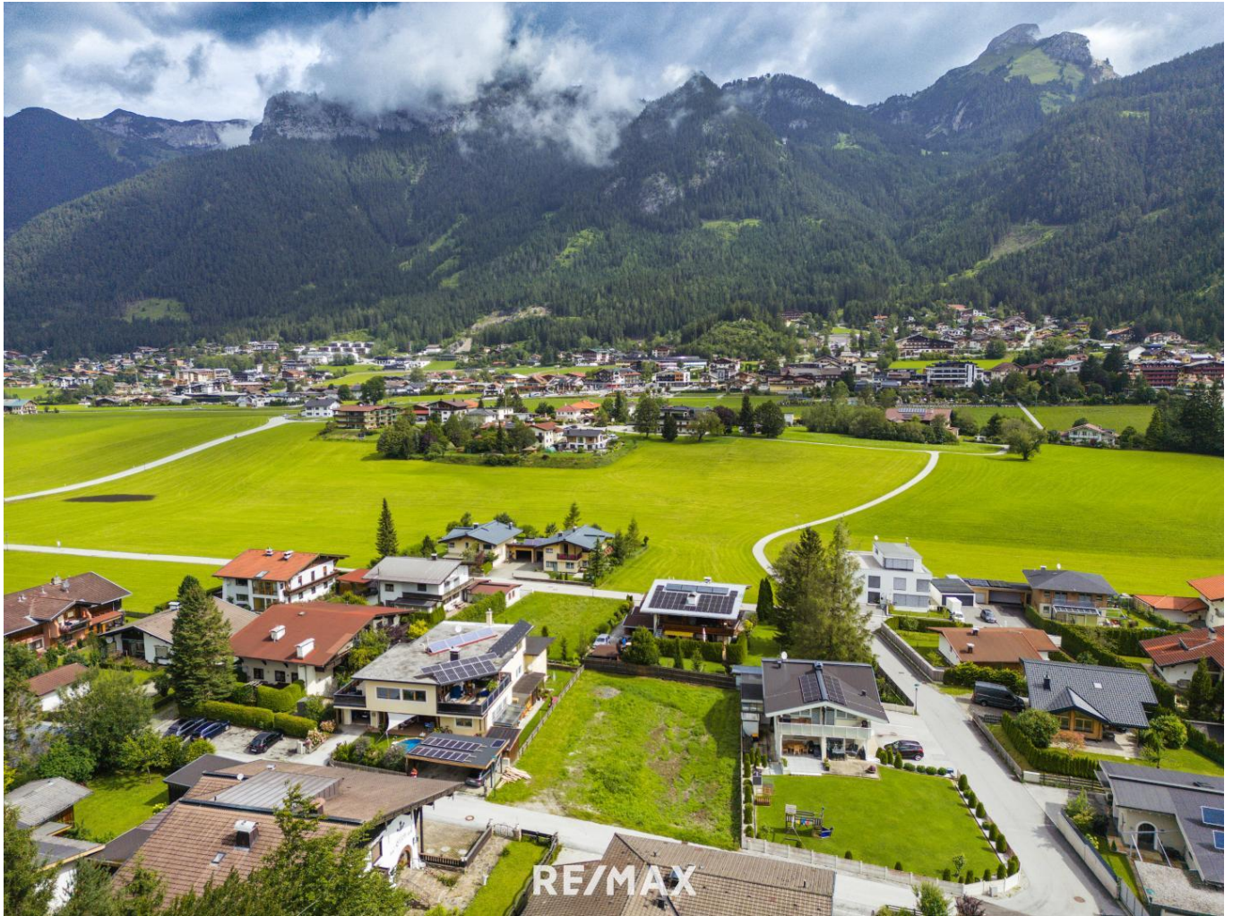
Grundstück - Eben am Achensee