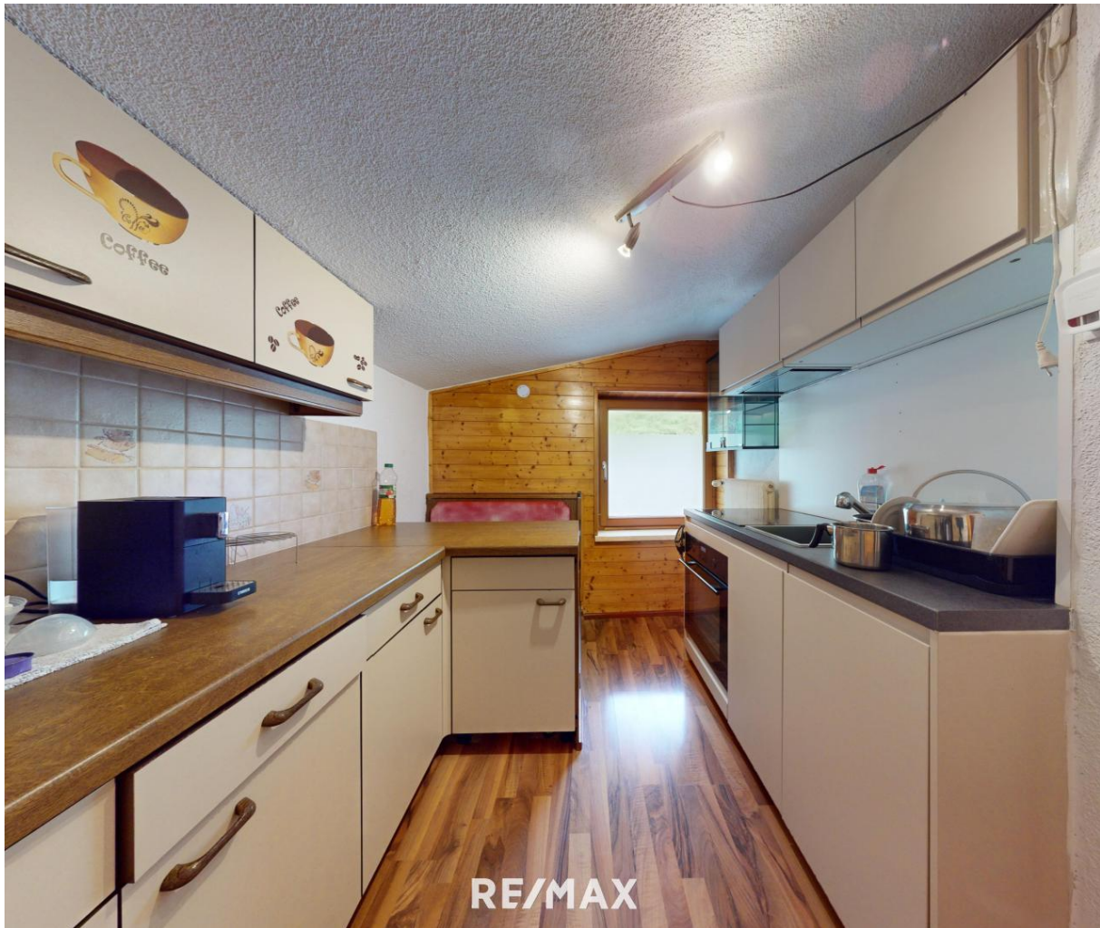
Wohnung - Küche