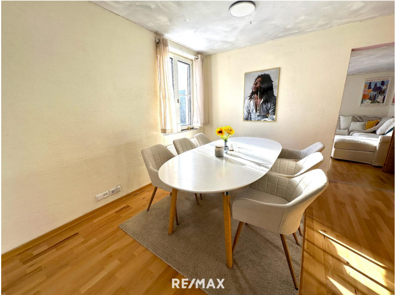
Wohnung - Speisebereich