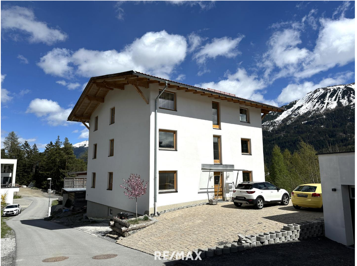
Wohnung - Außenansicht