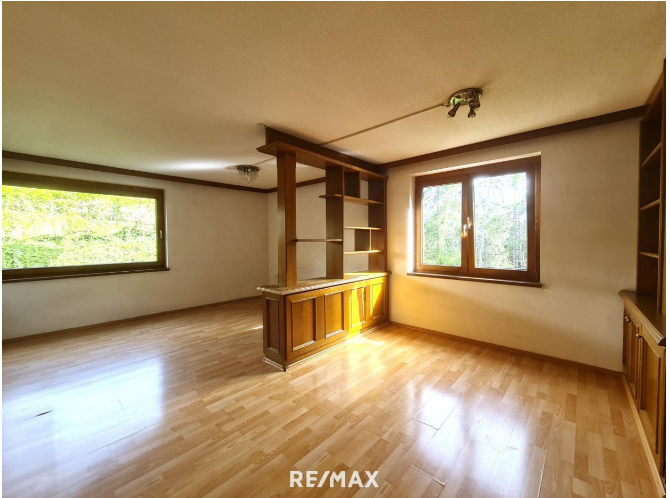
Wohnung - Wohnbereich