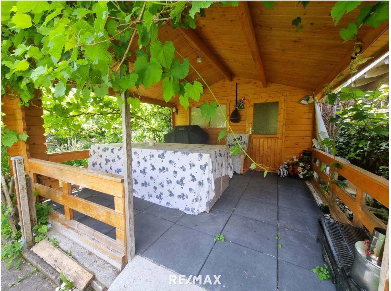
Wohnung - Imst - Gartenhaus