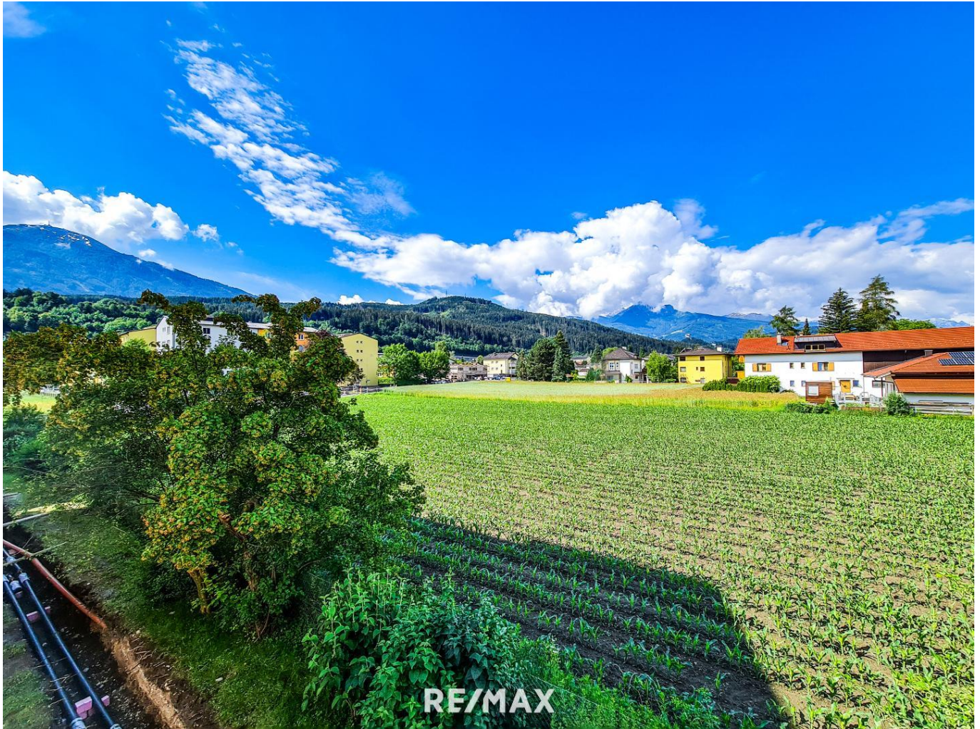
Wohnung - Aussicht