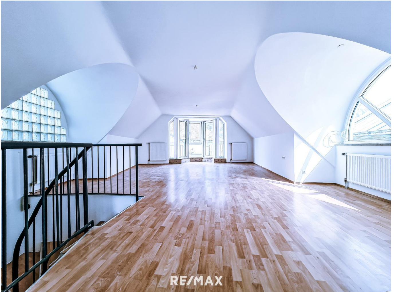
Wohnung - Wohnzimmer