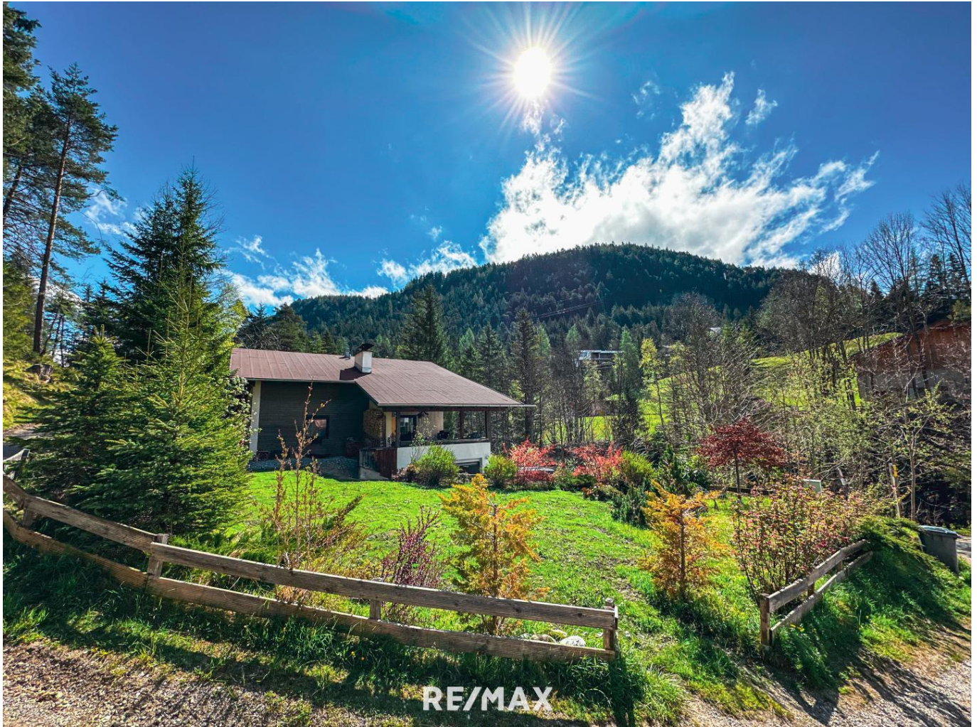
Grundstück - Seefeld