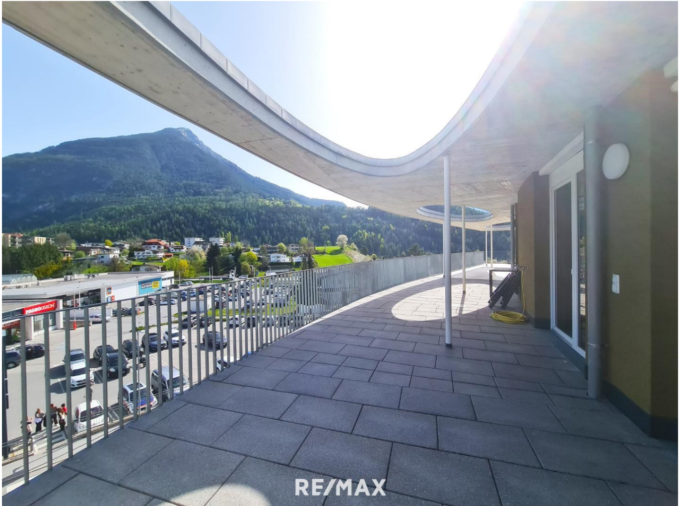
Wohnung - Terrasse