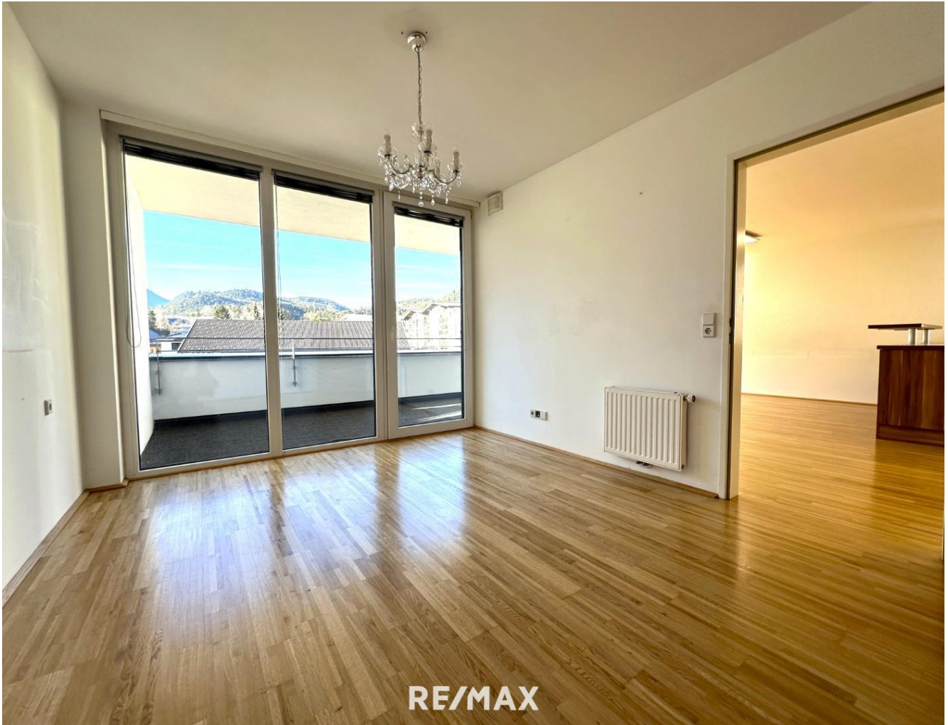
Wohnung - Zimmer