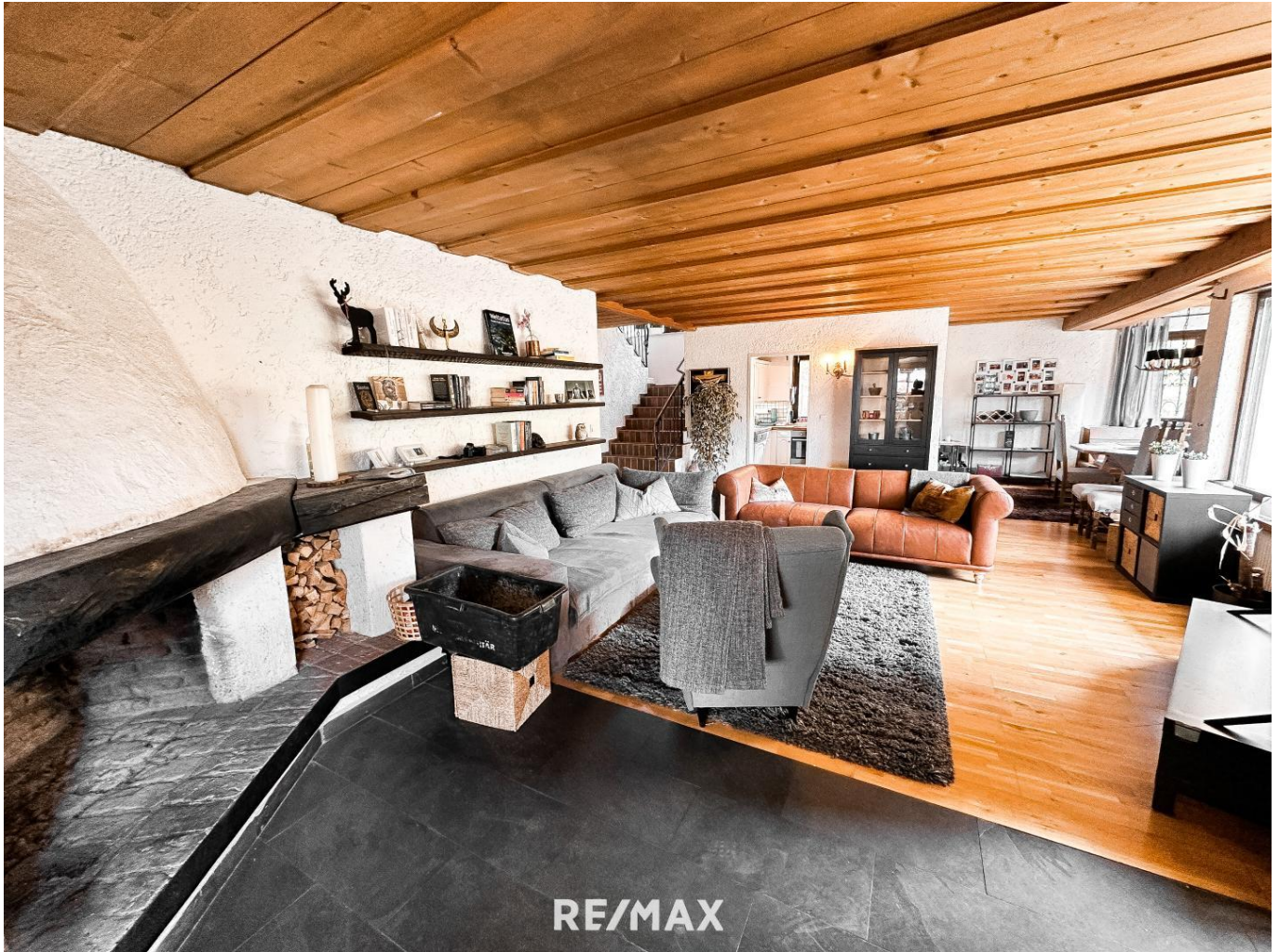
Haus - Seefeld - Wohnzimmer - EG