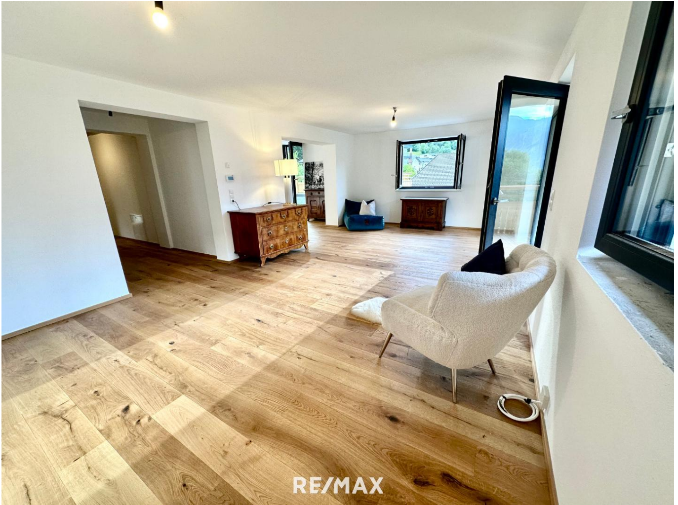
Wohnung - Wohnbereich