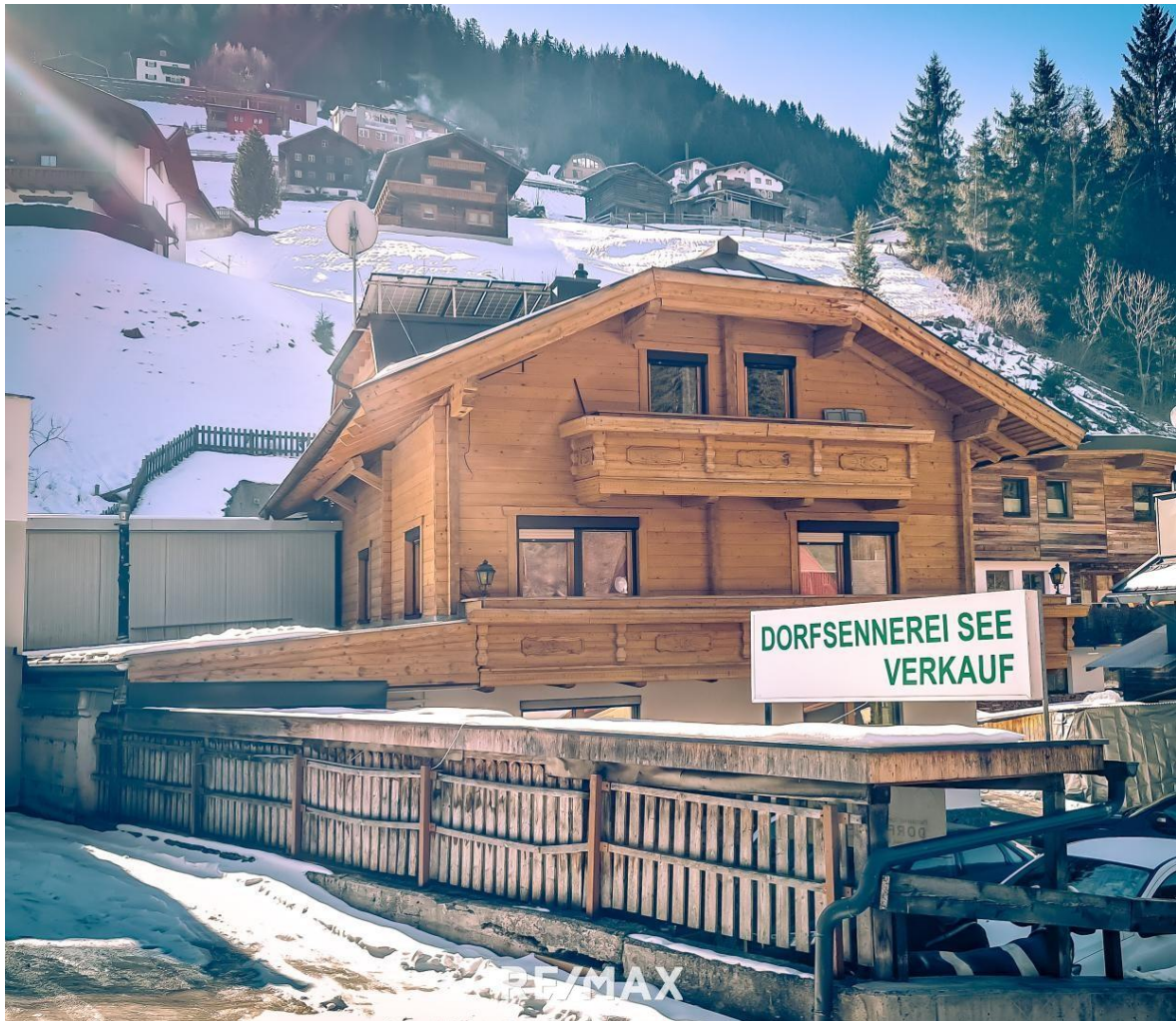
Wohnhaus - Außenansicht