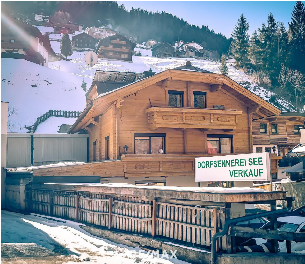
Wohnhaus - Außenansicht