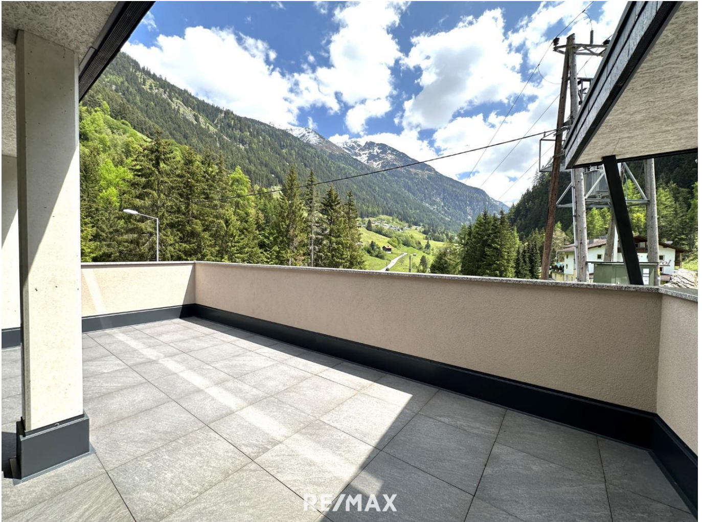
Haus - Terrasse