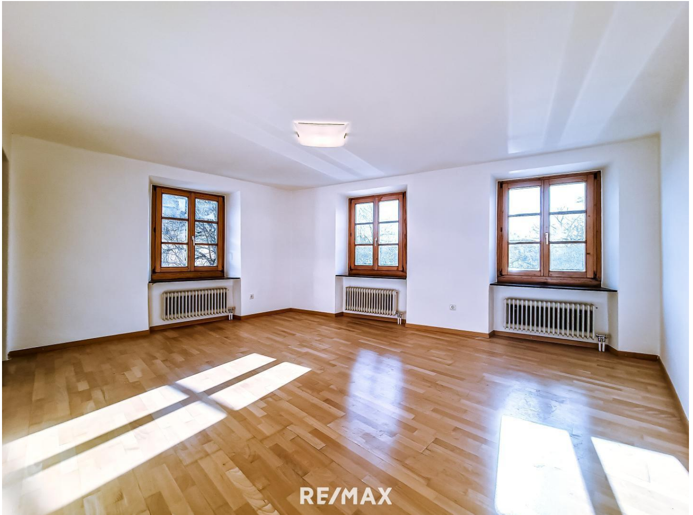
Wohnung - Hall in Tirol - Wohnzimmer