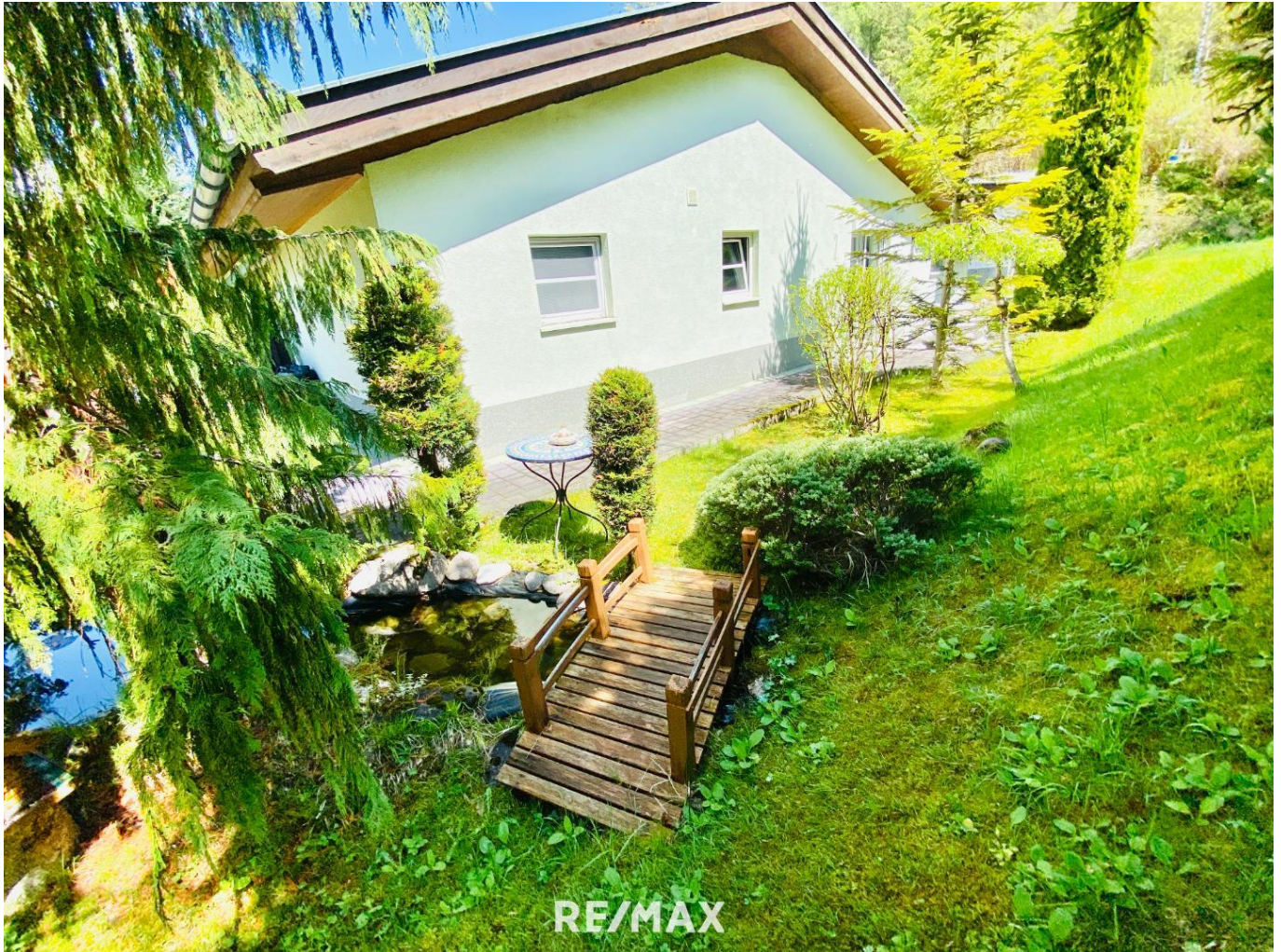
Haus - Außenansicht