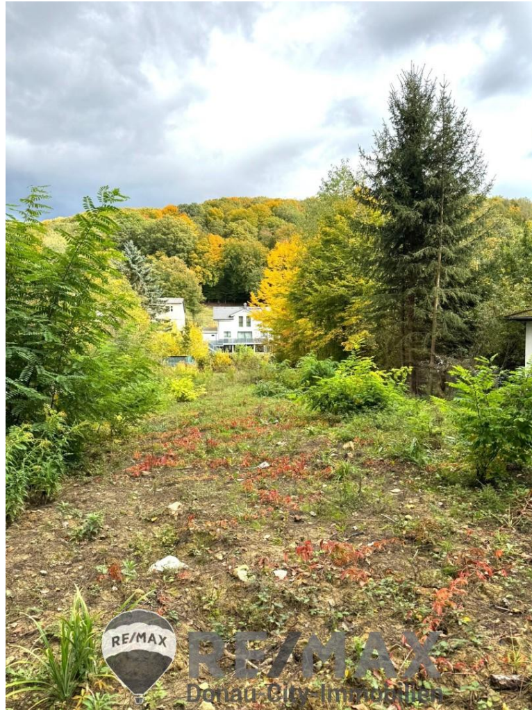
01 Baugrund in Mauerbach