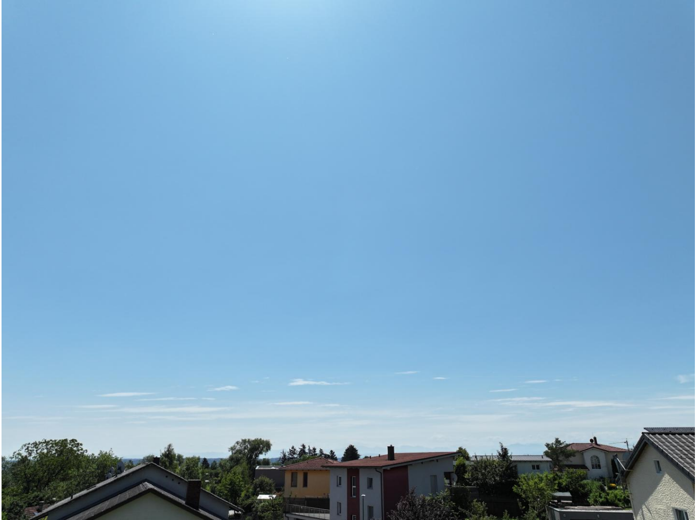
Ausblick von der Dachterrasse