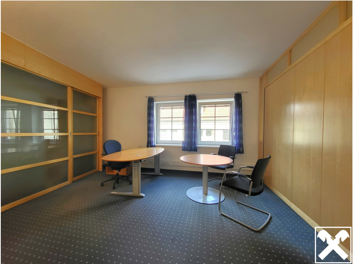
Büroraum 1_Bild 1