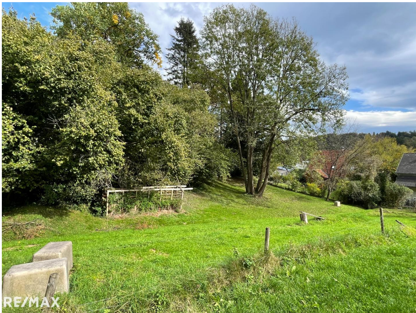
Blick von der Zufahrtsstraße