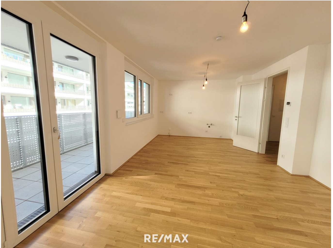
Wohnküche mit Balkonausgang

Objektnummer: 1609_42029 Eine Immobilie von RE/MAX First