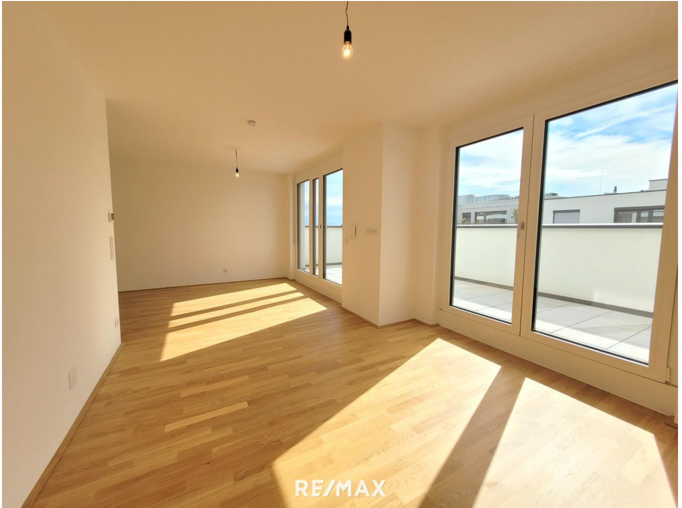
Wohnzimmer mit Terasse