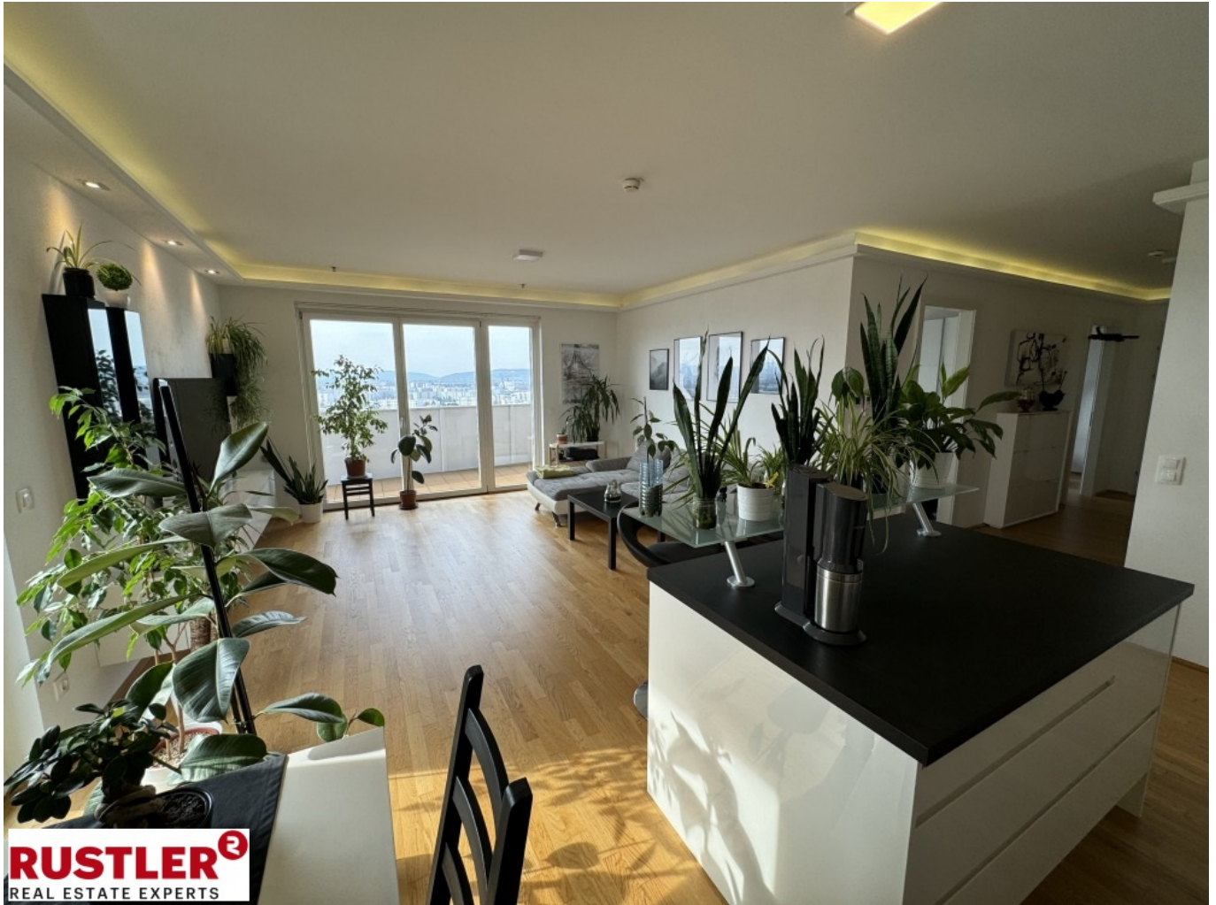
Blick ins Wohnzimmer