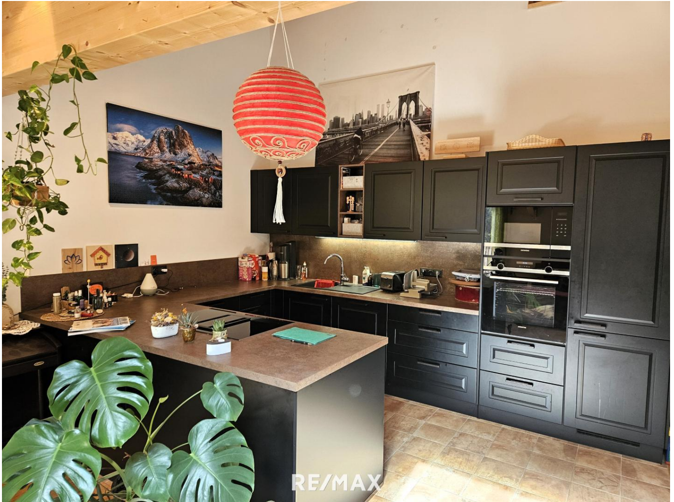
Küche / kitchen

Wohnen, wo andere Urlaub machen- touristische Vermietung erlaubt!