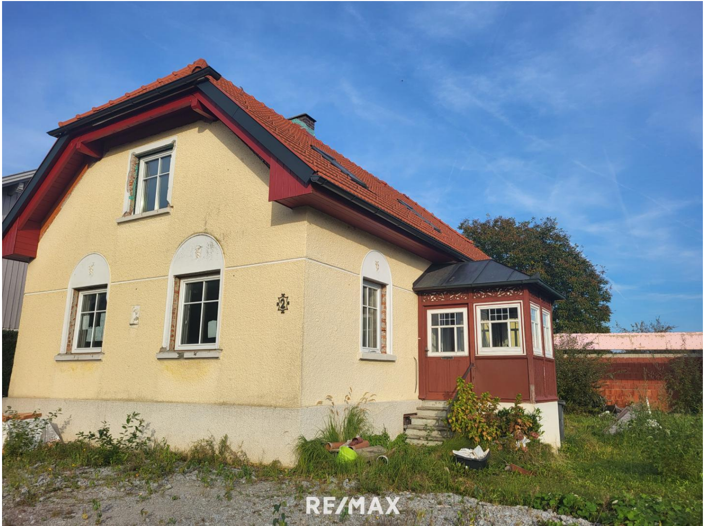
Haus Andorf (1)