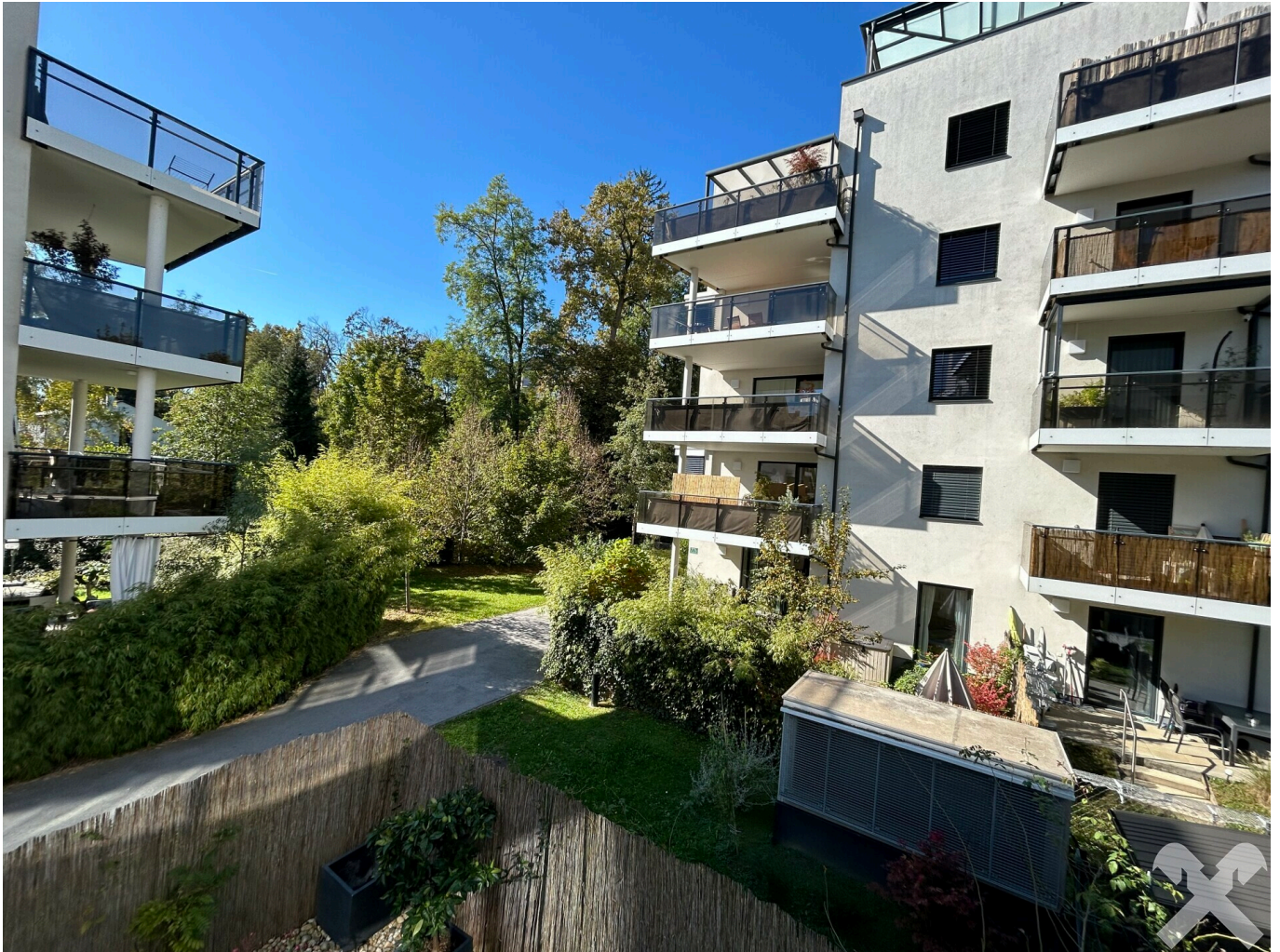
Exklusive Villenlage zwischen KFU und Hilmteich