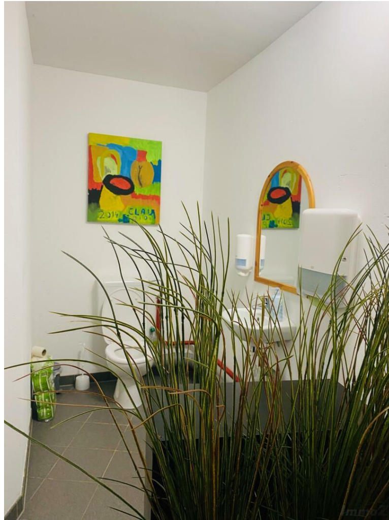
Ansicht Lager mit WC