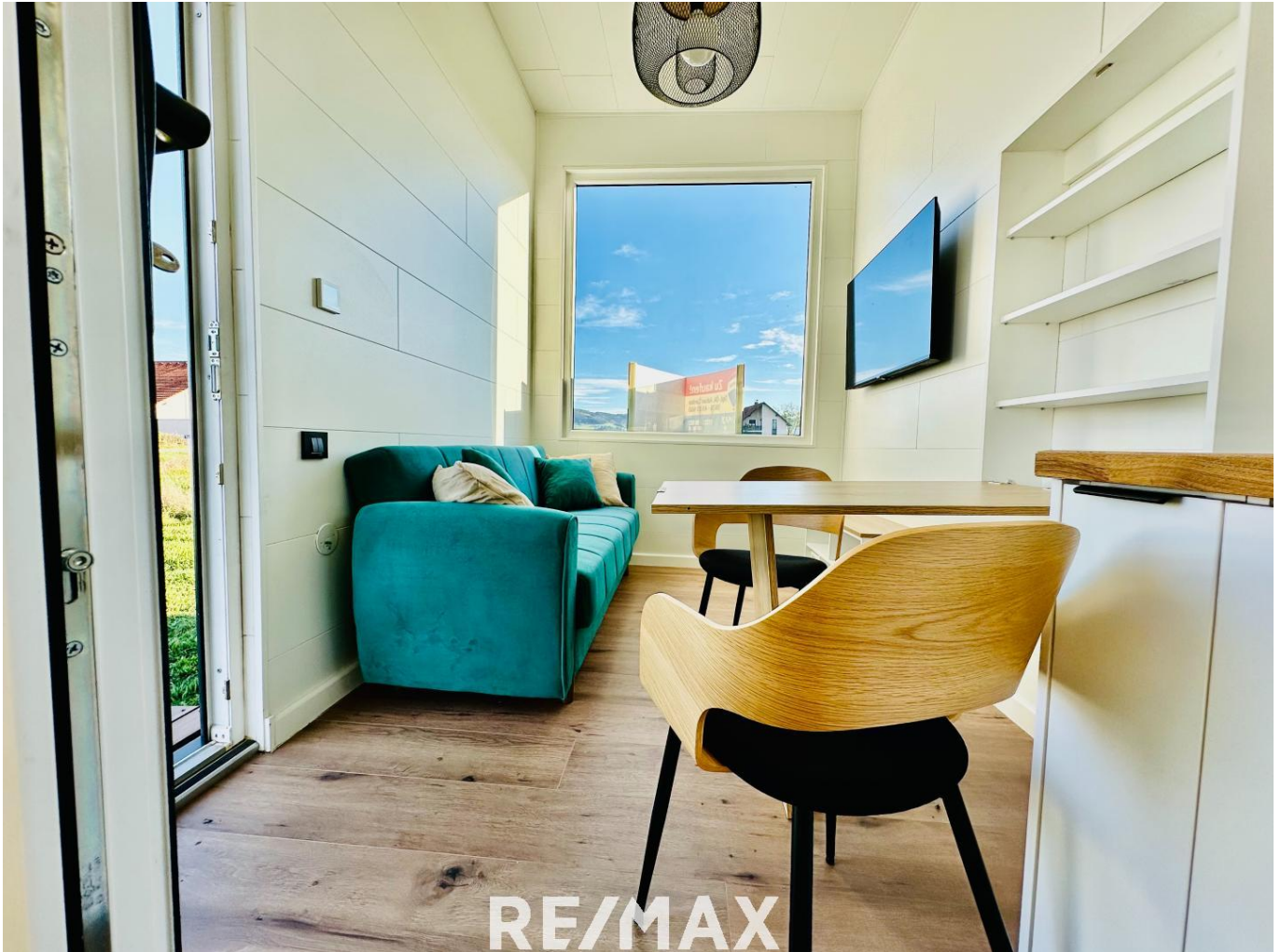
Charmantes Tiny House mit Baugrundstück