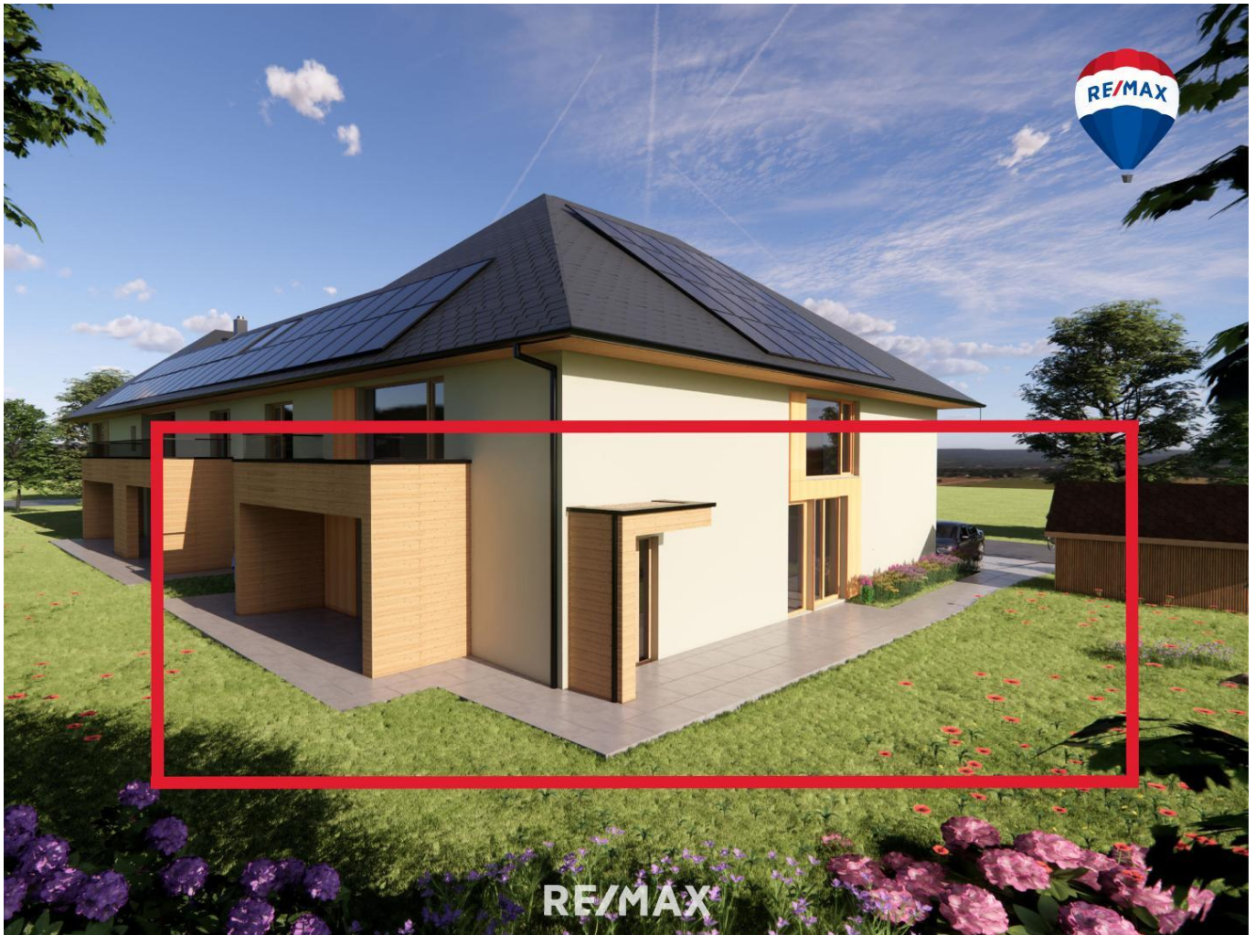
Ansicht Eingangsbereich - Terrasse - Süd