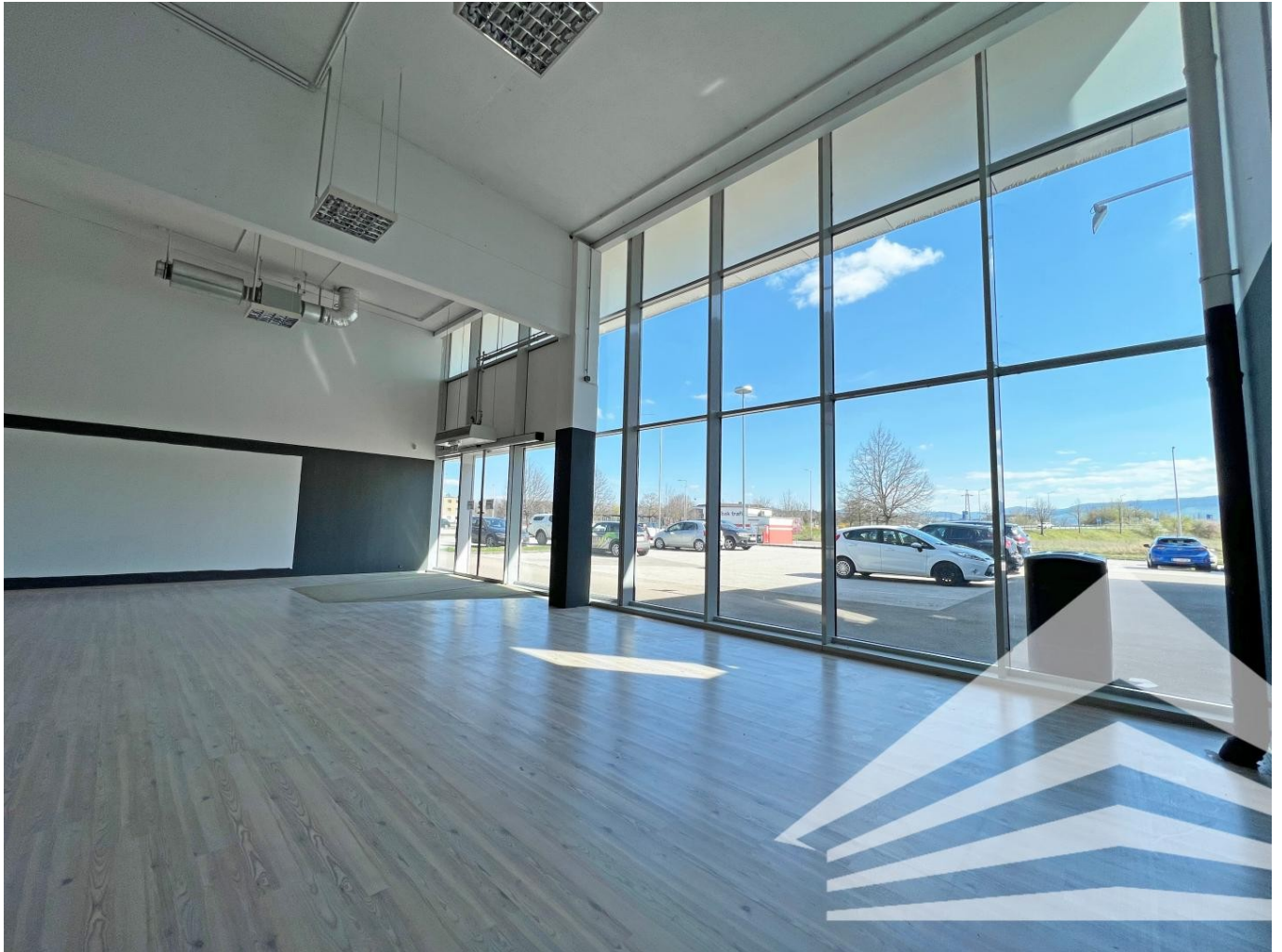
Eingang | Schaufensterfront