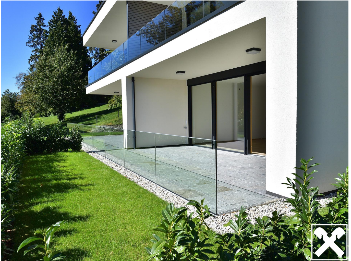
Top 1_1 Gartenwohnung