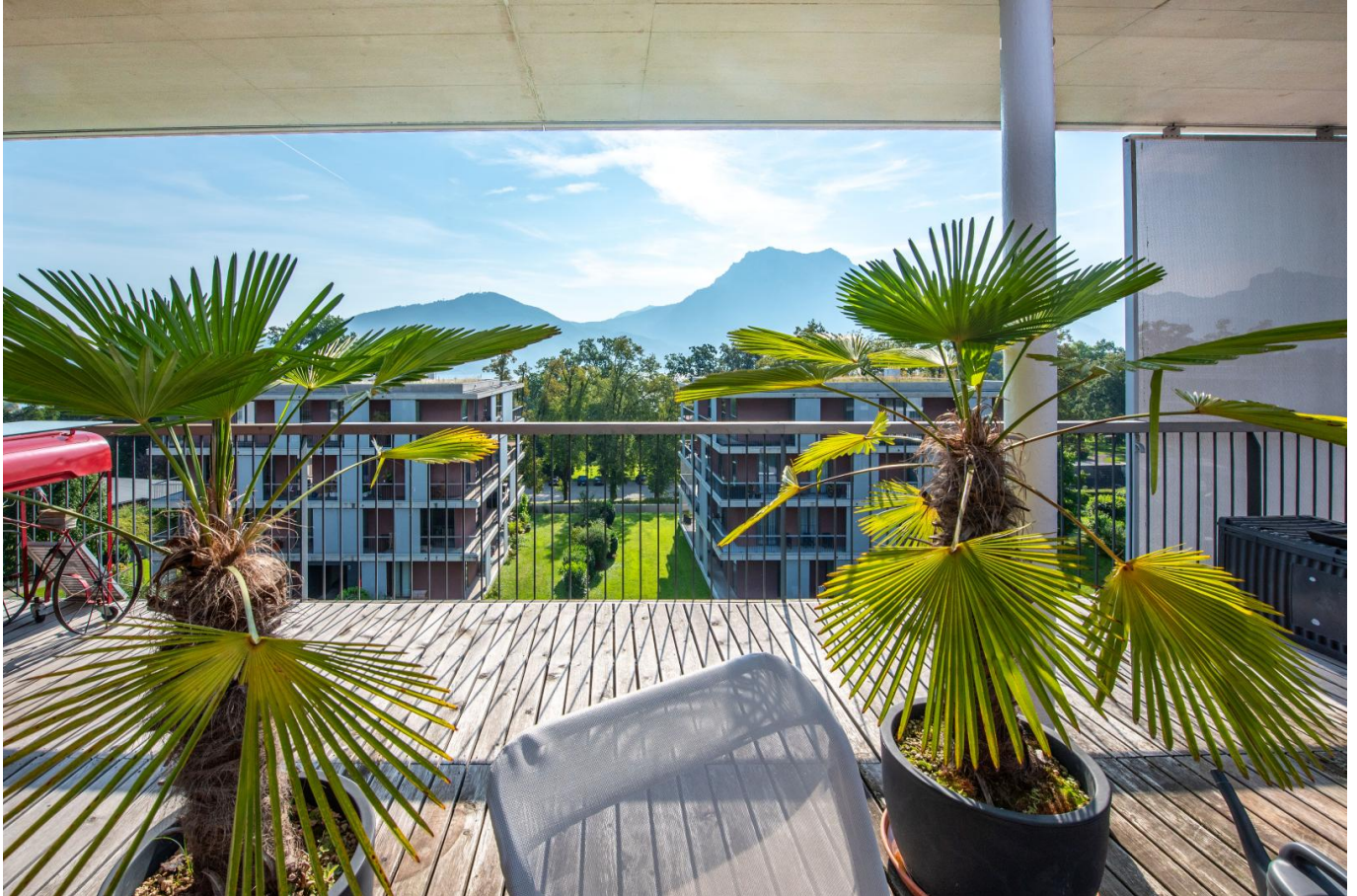
Terrasse mit Ausblick